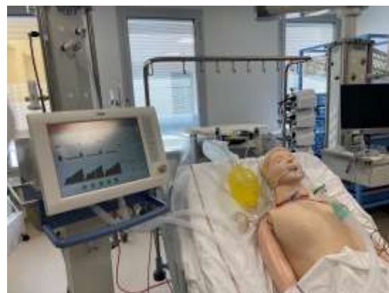
Salle de déchoquage